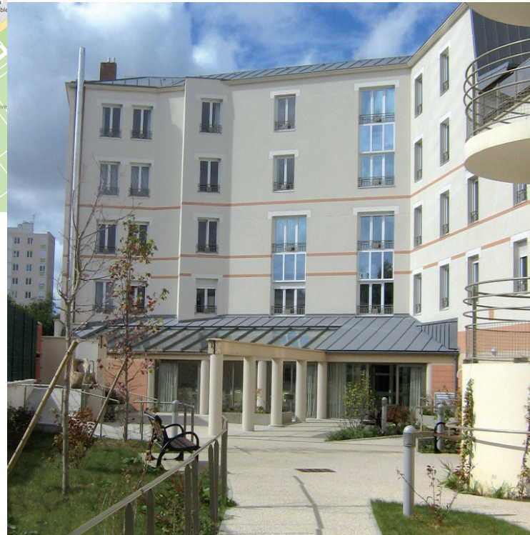
Création GDFE - www.gdfpe.fr